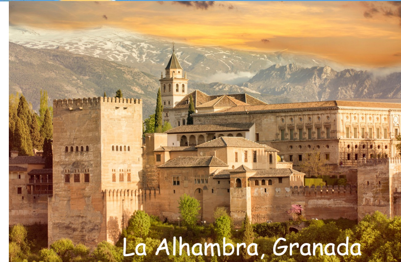
La Alhambra, Granada